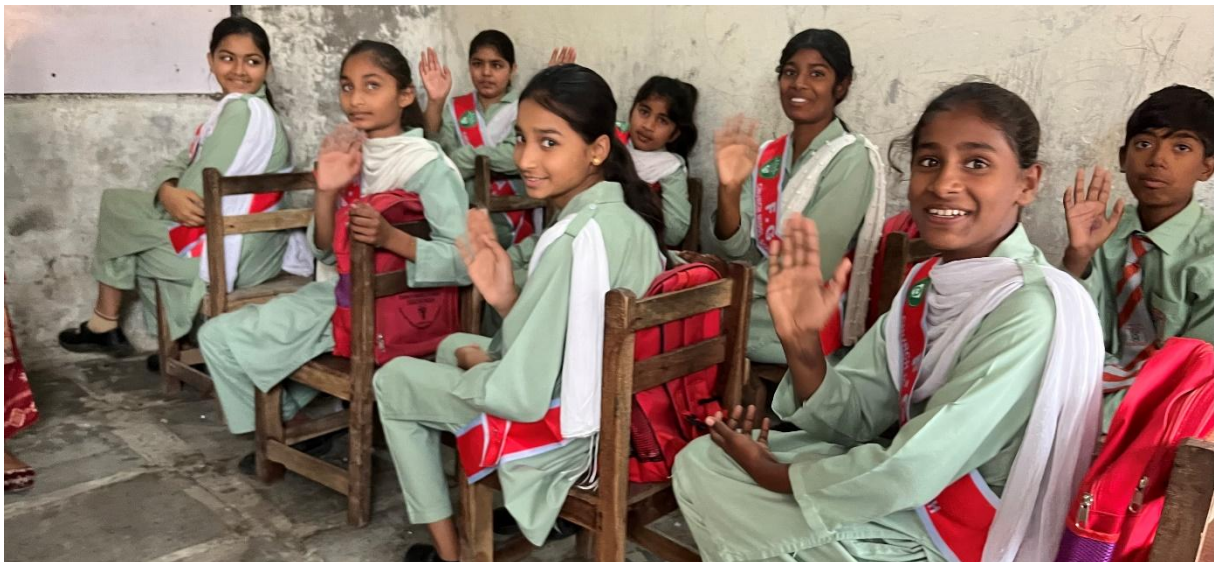
Kinderen van de FGA school in Sialkot.

Sommigen zeggen dat onze gezamenlijke inspanning slechts een druppel op een gloeiende plaat is. Dan zeggen wij ... je zult die druppel maar op jouw hoofd krijgen!