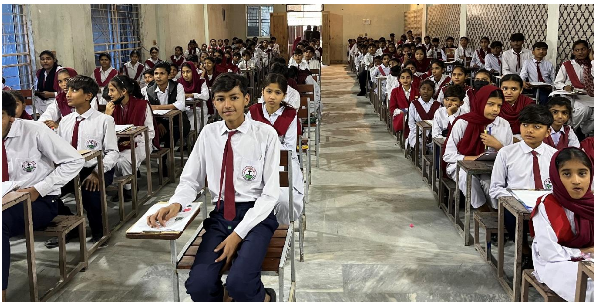
De Holy Field school is met 350 leerlingen een grote school.

Zo is het inmiddels gegaan! Het bestuur ging akkoord. De zonnepanelen zijn geïnstalleerd, de schoolleiding is dankbaar en wij hebben afscheid genomen. Een prachtige duurzame oplossing!