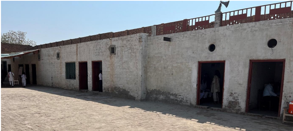
De veestallen waarin de Progress of Life school momenteel is gehuisvest.