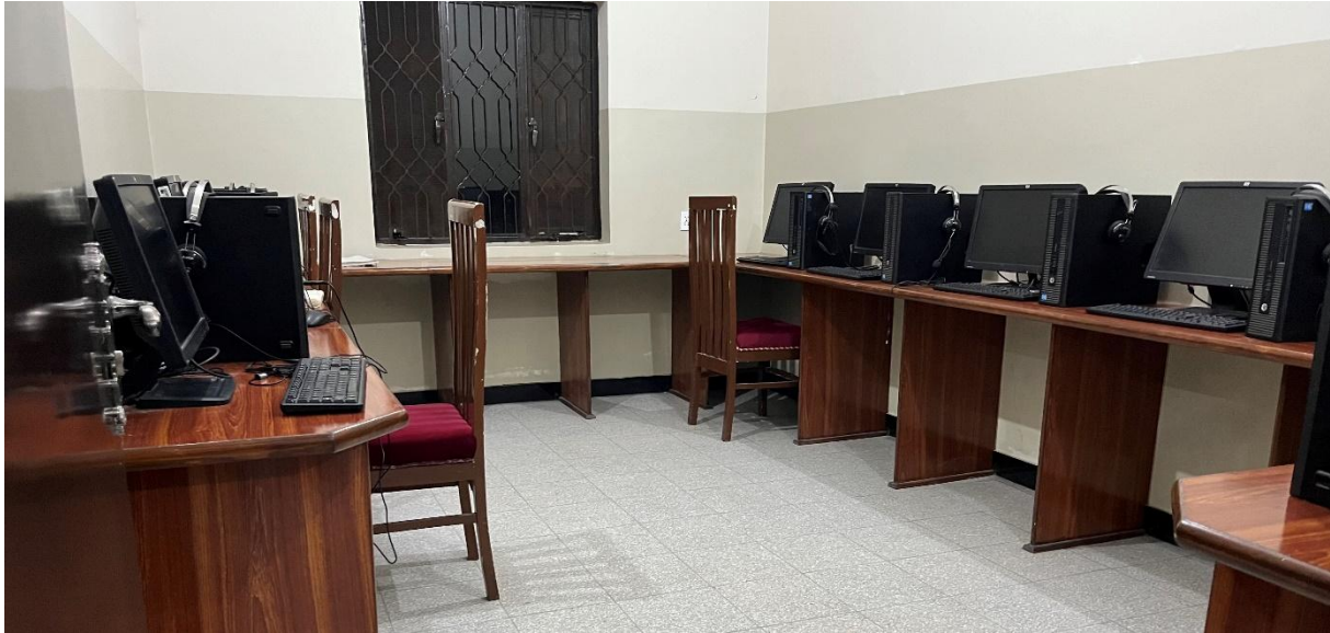
Hier kunnen de blinde meisjes zelfs leren om met computers om te gaan!

scholen. Ook is er een bezoek gebracht aan het Ananias tehuis voor blinde meisjes, dat met een grote bijdrage vanuit Nederland substantieel kon worden uitgebouwd.